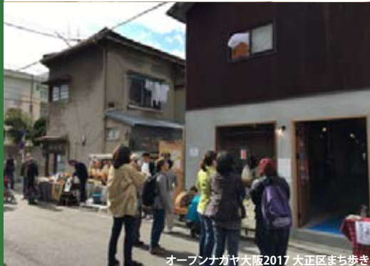
オープンナガヤ大阪2017 大正区まち歩き