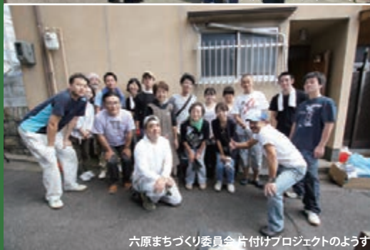
六原まちづくり委員会片付けプロジェクトのようす