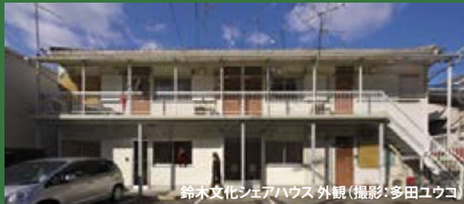
鈴木文化シェアハウス 外観